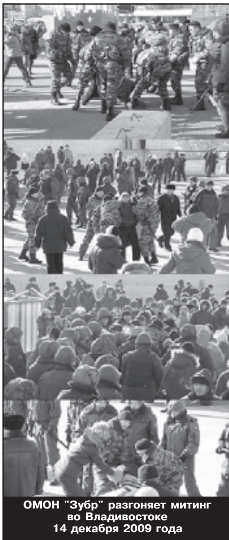
ОМОН "Зубр" разгоняет митинг во Владивостоке 14 декабря 2009 года

В прошлом году "Зубр" оборудовал свой собственный КПП, который находится на самой окраине Щелково-7. Местный таксист на просьбу показать, как удобнее добраться до входа на базу, машет рукой: "Там бетонная коробочка сразу за мусорками - не заблудитесь". Действительно, за длинной шеренгой мусорных баков построено что-то вроде накопителя - вход на КПП дополнительно огорожен высокой стеной. Напротив базы стоят несколько сильно потрепанных хрущевок. Территория "Зубра" огорожена трехметровым забором с колючей проволокой - любая попытка к бегству за-