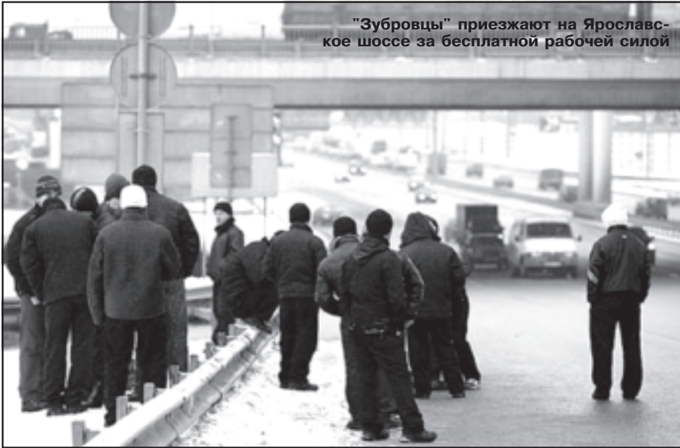
"Зубровцы" приезжают на Ярославское шоссе за бесплатной рабочей силой

Да, рабы. Это было очень жестоко, в начале очень жестоко было, смотреть было тяжело, я сама не ожидала, что такое может быть, если честно.